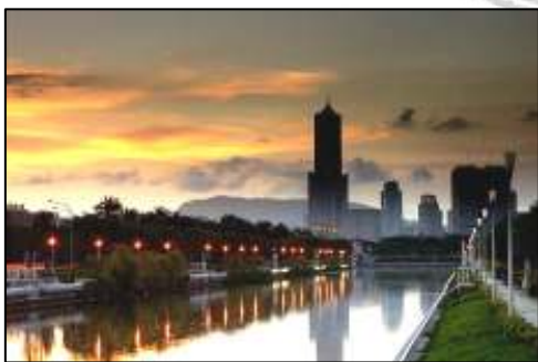
照 3-13 高雄市

從高雄歷史歷程來看，在過去台灣發展的過程中，從日本統治時期即將全島工業重心置於高雄，國民政府遷台後，延續的，將高雄市視為工業發展的重點，高雄市為台灣第二大都市和第一大港，亦是南台灣經濟發展的核心。過去高雄市被列為工業經濟發展的重心，吸引大量勞動人口聚居，形成今日的工商港埠，也塑造出高雄的重工業都市形象。