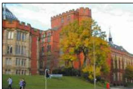
照 3-2 雪菲爾大學