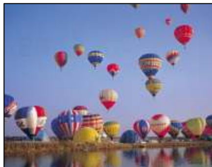
照 3-9 國際熱氣球節