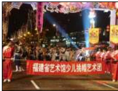
照 3-12 妝藝大遊行