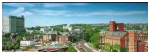
照 3-3 雪菲爾都市