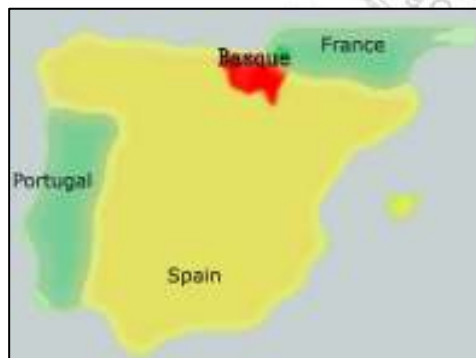
圖 3-2 巴斯克地理位置圖

巴斯克人從四千多年以前就一直居住在上述的分佈地，這讓他們與西班牙其他地區人民相比時覺得自己才是伊比利半島上的原住民，其他都是後來的。他們可能是歐洲最古老的族群，在印歐民族遷入該區以前就已經居住在該地。雖然歷史上不斷遭受外來民族的侵略，但是在伊比利半島上的住民大部份遭受羅馬化之際，他們也未曾屈服，並將自己的語言文化保存了下來。他們具有強烈的族群自我意識，四千多年來一直能保有自身獨特的生活方式與文化。(張文榮，2001)