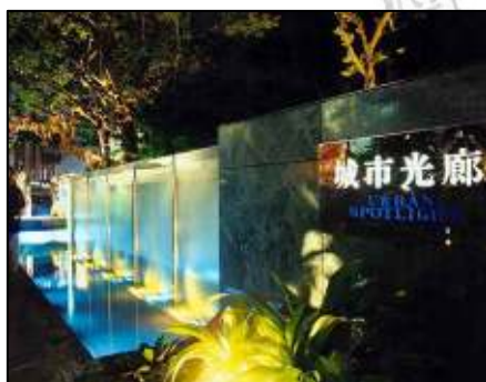
照 3-15 都市光廊