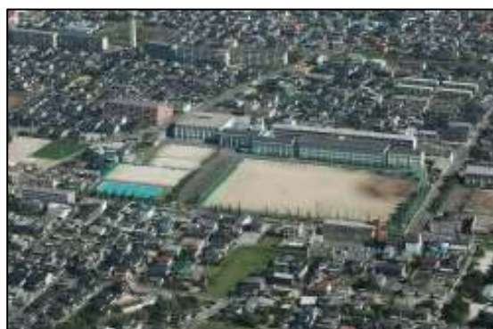
照 3-7 佐賀都市