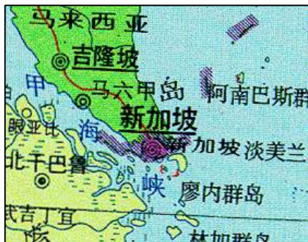
圖 3-4 新加坡地理位置圖

馬來語、泰米爾語為官方語言，英語為行政用語。主要宗教為佛教、道教、伊斯蘭教、基督教和印度教。