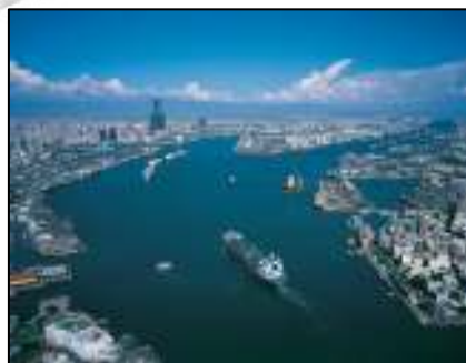
照 3-14 海洋之城