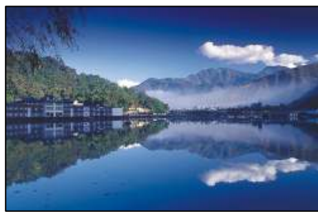
照 3-18 鯉魚潭