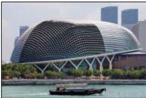
照 3-11 濱海藝術中心