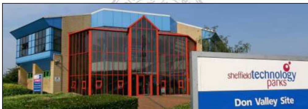
照 3-1 雪菲爾文化產業區(Cultural Industry Quarter)