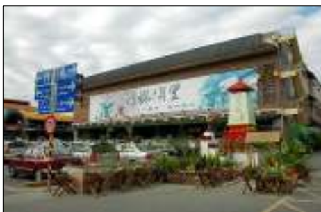
照 3-19 埔里酒廠