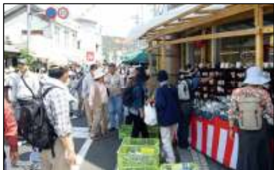
照 3-8 有田陶器市