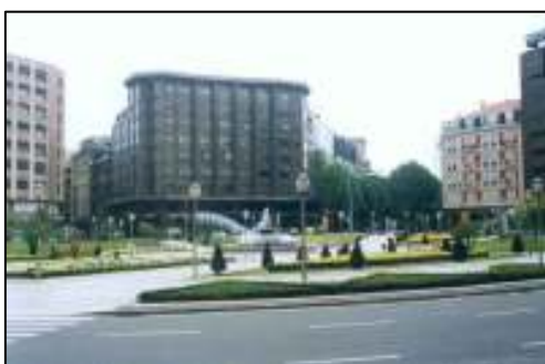
照 3-5 畢爾包都市