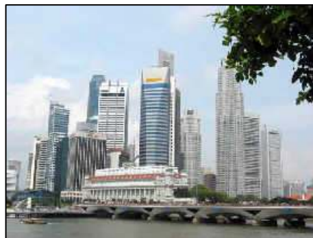
照 3-10 新加坡都市