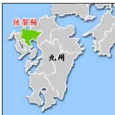
圖 3-3 佐賀地理位置圖

佐賀自古即以陶瓷工藝聞名於世，因而有「陶瓷的故鄉」美稱，尤其在 1898 年吉野之里古村落遺跡出土後，更讓它名留青史。由於佐賀北濱玄界灘、南臨有明海，境內青山綿延、綠意青蔥，地理位置險要，因此一直是進出九州的重要隘口。佐賀熱情的民風、精雕細琢的陶瓷工藝、美味實在的鄉土料理，正是佐賀最為人津津樂道之處。