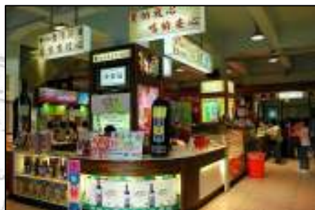
照 3-20 酒業文化產業