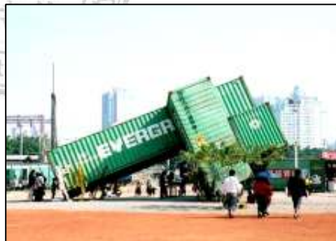
照 3-16 國際貨櫃藝術節

資料來源： http://kcginfo.kcg.gov.tw/tgs_newspic/46f32ffd2f403/photo_02.jpg http://dm.kaoh.com.tw/kcginfo/200312/image/art.jpg