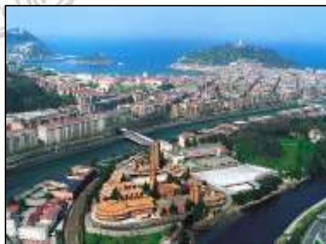
照 3-4 巴斯克都市