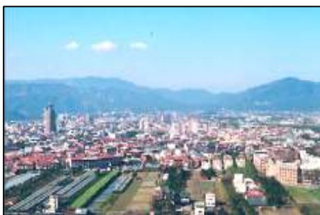
照 3-17 南投埔里

埔里是一個藝術氣息十分濃厚的小鎮，鎮內直接、間接從事藝術工作的人，保守估計有近千人之多，在人口僅有八萬多人的山城裡，這樣的比例著實令人驚奇。不只數量眾多，國內知名的藝術家如：已然過世的畫家席德進、楊英風教授、朱銘無不把埔里作為第二故鄉，而在地的文史、藝術工作者更是人才輩出，因此有人建議要把「藝術家」也當作是埔里的特產之一。