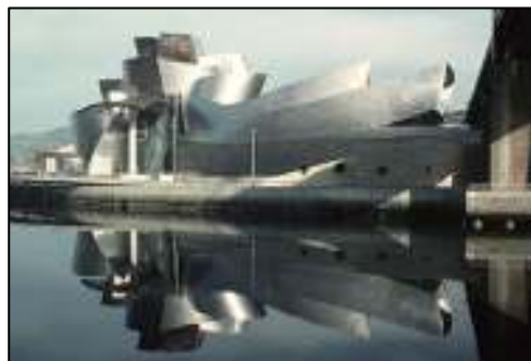
照 3-6 古根罕美術館