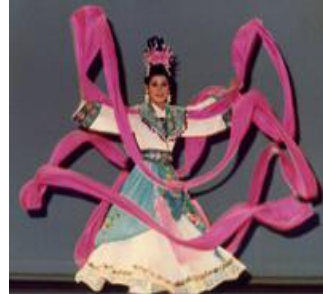
圖 1-2 杜麗玲演出彩帶舞