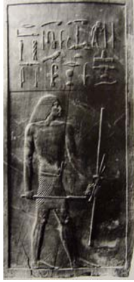
【圖十】赫斯拉鑲板肖像.....33