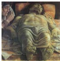
【圖十二】安息的基督.....33