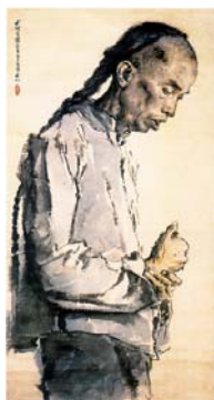
【圖四】蔣兆和《與阿 Q 像》.....19