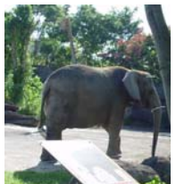
【圖二十】台北市木柵動物園的大象.....53