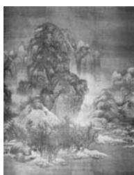
【圖五】范寬《雪景寒林圖》.....22