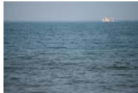
【圖十六】北海岸 大海一隅.....45