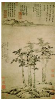
【圖八】倪瓚《六君子圖》.....29