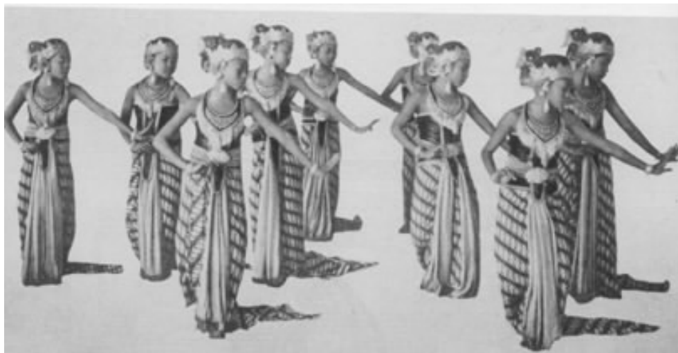
貝達雅舞蹈演出隊形