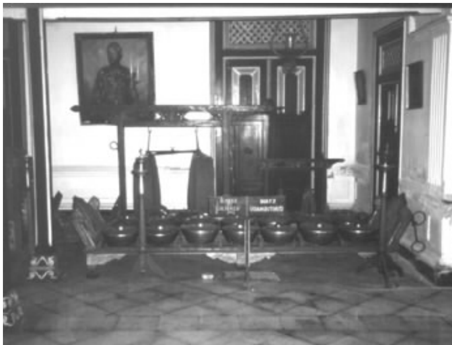
日惹宮廷甘美朗塞卡坦使用樂器

知穆罕默德的誕辰與忌日，藉以傳播伊斯蘭宗教思想與作為蘇非密契主義的修行之道。 14 早在西元十六世紀以前的爪哇印度教滿者婆夷(Majapahit)王朝，傳統藝術型態無論在宗教或世俗生活上都扮演著非常重要的角色，十六世紀以後伊斯蘭聖者也知道傳統藝術是爪哇人表達宗教情懷的方式與媒介。因此，儘管正統伊斯蘭對音樂採較為負面的態度，但印尼伊斯蘭對這些受到印度教文化影響的傳統藝術型態採較為寬容的態度，甚至融合傳統藝術於伊斯蘭宗教儀式之中，而甘美朗塞卡坦就是一個最典型的例子，如今甘美朗塞卡坦的演出已經被認為是中爪哇宮廷一個古老、神聖而不可或缺的伊斯蘭宗教儀式(Hood 1984:105)。