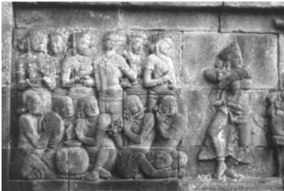
建於西元八世紀中爪哇佛教 Borobudur 樂舞浮雕

各種不同宗教價值的結合。儘管十三世紀以後印尼爪哇人開始慢慢改宗伊斯蘭教，但由於穆斯林在改宗以前長期沉浸在印度教/佛教的文化當中，印度教/佛教文化早已經深植人心，改宗的現象並沒有導致傳統爪哇印度文化的瓦解。相反的，傳統泛靈主義思想與印度教/佛教的教旨與活動提供了伊斯蘭密契主義一個重要養分，致使印尼伊斯蘭成為容納神秘活動的器皿( wadah )，藉此來展現真主阿拉、密契主義與神秘力量( kasekten )三者之間的關係，也因此印尼的伊斯蘭教中，神秘活動往往被特別的突顯出來 (Koentjaraningrat 1995:560)。 3